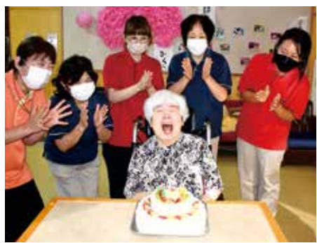
こぶし園代表作品