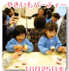
やきいもパーティー