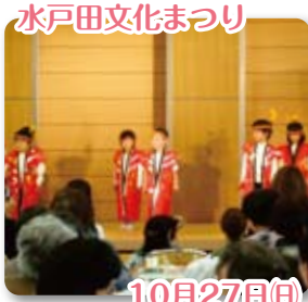
水戸田文化まつり