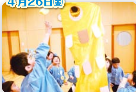
子どもの日の集い