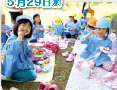
遠足(太閤山ランド)