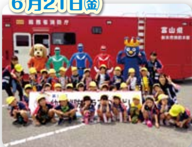
幼年消防クラブの集い