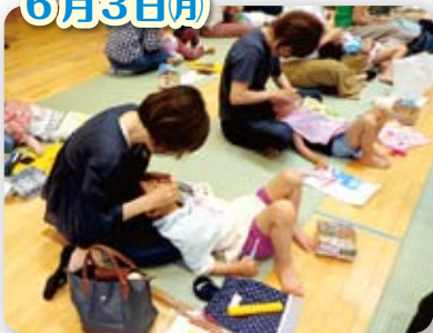
親子歯みがき教室