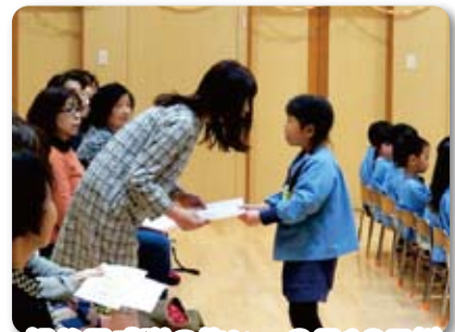
祖父母感謝の集い：3月19日(火)