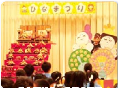
ひな祭り会：3月1日(金)