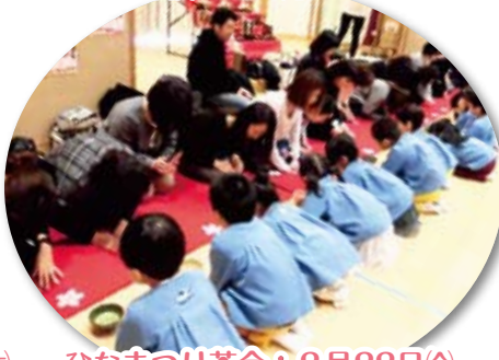
ひなまつり茶会：2月22日(金)