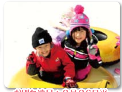
お別れ遠足：2月26日(火)