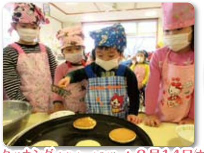
クッキング(パンケーキ作り)：2月14日(木)