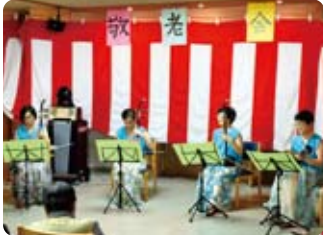
二胡& マンドリンシスターズ 9月19日(水)